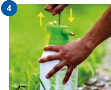
4 Agite la palanca del mango hacia arriba y hacia abajo (máximo 10 veces).