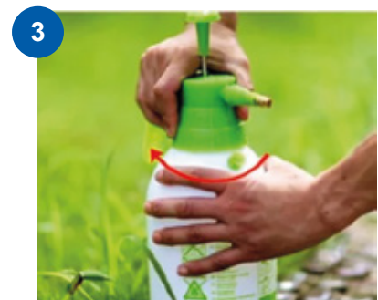
3 Enroscar la tapa al frasco.