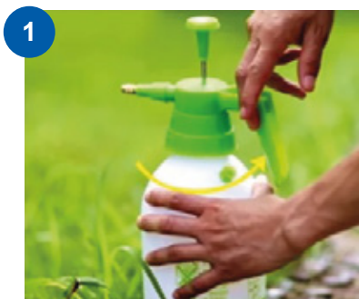
1 Desenroscar la tapa.