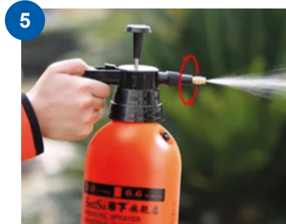
5 Gire la boquilla dosificadora y ajuste el nivel de spray deseado.