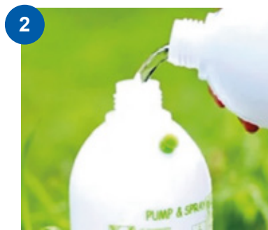
2 Agregar el producto líquido.